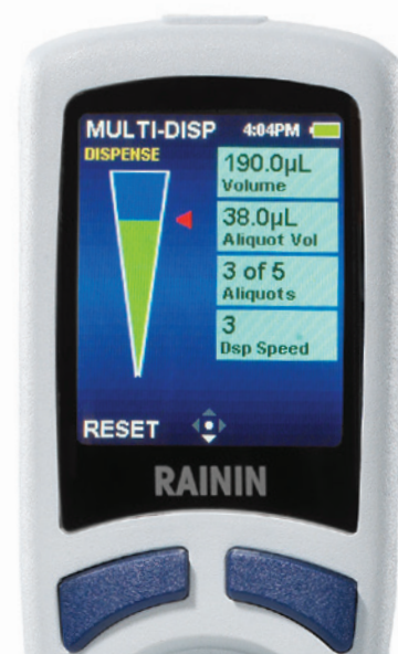
E4 XLS+ en mode Multidistribution