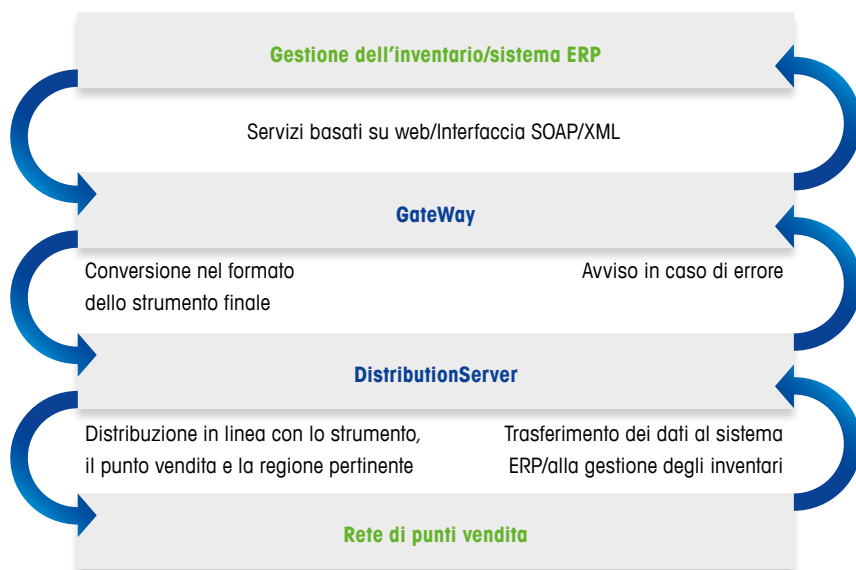
Diagramma di comunicazione

“Manteniamo i nostri dati autenticati presso la sede centrale e li trasferiamo a ogni singolo punto vendita tramite GateWay. Gestendo a livello centralizzato i dati dei prodotti, evitiamo gli errori di etichettatura locali: sarebbe troppo alto il rischio di omettere l’elenco corretto degli allergeni”.